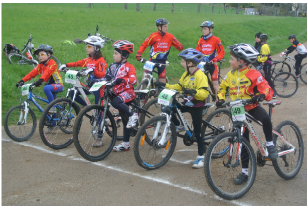
Illustration des articles de cette page le départ des 9-10 ans avec deux jeunes filles (manque sur la photo Eva Vilnus), quatre clubs différents (de gauche à droite Manom, Woustviller, Flavigny, Bouxières)

110 inscrits à Flavigny, 80 à Fameck, 115 à Bouxières, on se rapproche du record établi en 2012 à Char- mes avec 125 participants, chiffre atteint lors de le reprise depuis 2012. Pas mal si l'on se réfère à certains rendez vous où l'on arrivait seulement à une petite quarantaine d'inscrits comme en 2009 dans la cité de la lutherie. Ceci permet d'afficher des sourires sur les visages des organisateurs et accessoirement à Guy Haag de déclarer: » Je suis satisfait même s'il y a encore quelques zones d'ombre, zones auxquelles nous allons nous atteler. Je note avec satisfaction qu'en dépit de conditions météo peu réjouissantes hormis Bouxières, il y a du monde et qui plus est dans quasiment toutes les catégories, même chez les féminines qui traditionnellement sont le parent pauvre en vtt et en particulier à l'Ufolep. » Ainsi à Bouxières, on pouvait relever 18 minimes, catégorie la plus fournie, mais aussi 16 juniors alors qu'il n'y en avait plus il y a trois ans. Autre exemple les séniors A où ils étaient 8 à prendre le départ. Combien étaient ils l'an passé? Aux côtés des têtes connues, sont venues s'ajouter de nouveaux visages comme quelques non licenciés ou encore des porteurs de nouveaux maillots. Notons également pour clore ce chapitre sur la participation que certains clubs bien établis se déplacent encore plus nombreux, y aurait il de l'émulation pour le challenge de la participation?