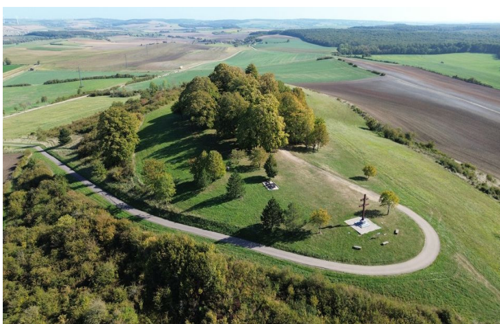
Illustration des propos de Sam avec ci-dessus le Mont St Pierre 57 près de Villers Stoncourt) haut lieu de la résistance et le même endroit (photo moto d'un jour).

Certains lieux, monuments prennent une autre dimension vus de haut, il suffit de regarder une émission tv comme « des racines et des ailes » pour mesurer l'importance de la prise de vue aérienne qui compose les 2/3 voire les 3/4 des images. Sam n'est pas réfractaire à cet aspect de la photo: » utiliser un drone est très intéressant, cela procure un autre regard. Il y a des contraintes avec la législation comme par exemple les animaux que l'on ne peut survoler mais le visuel est vraiment différent. »