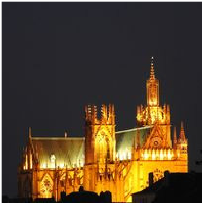
« J'aime jouer avec la lumière » comme ici avec la cathédrale de Metz

Vous avez peut être plusieurs vélos comme par exemple un vtt pour s'entraîner et un pour les courses ou encore un vélo de route et un vtt. La passion de notre ami s'exerce dans de telles proportions avec trois boîtiers, deux Nikon et un Canon. » Le P900 de chez Nikon me sert essentiellement pour les photos en extérieur: villes mais aussi pour les coucher de soleil ou encore photographier la lune. Je suis tellement satisfait de cet appareil, de cette marque que j'ai acheté le P1000 à la suite. J'utilise rarement le Nikon P1000 un véritable bijou. Je suis un « local guide Quant au Canon c'est celui que j'utilise sur les courses. »