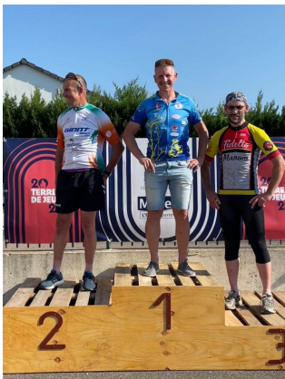
Le podium à Elzange: objectif atteint

Villerupt: c'est le dernier rendez vous. Comme je suis né ici, j'aime bien revenir « au pays ». Ici pas d'appréhension particulière hormis la célèbre montée.. Je finis 7ème. »