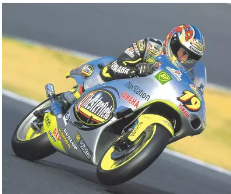
photo). J'avais manqué la retransmission du GP dans un café à Dieuze, un regret.....

Sans doute est ce parce que j'ai posté un article sur la 1ère victoire de Johann Zarco en Moto GP (Australie 22/10/23) qu'à peine arrivé il me parle de sa passion pour les courses moto: » je ne suis pas motard, n'ayant pas le permis mais je suis né et ai vécu dans le Pays Haut, à Villerupt plus précisément. Comme Olivier était un enfant du pays, j'avais adhéré à son fan club (il sort des anciens numéros de la gazette: l'écho du 19). J'ai ainsi assisté au GP de France au Castellet, un moment inoubliable, tout comme son titre de champion du monde 250» Sur ce nous évoquons des souvenirs communs comme ces soirées où le pilote rencontrait ses fans à Longuyon : » Vraiment un champion accessible qui répondait simplement à nos questions comme à un vieux copain » ou encore de cette finale de dingue du chpt du monde où le titre s'est joué à la dernière course et ce pour un écart infime (voir légende de