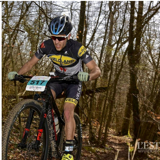
L'aspect physique est très prégnant en XC.....