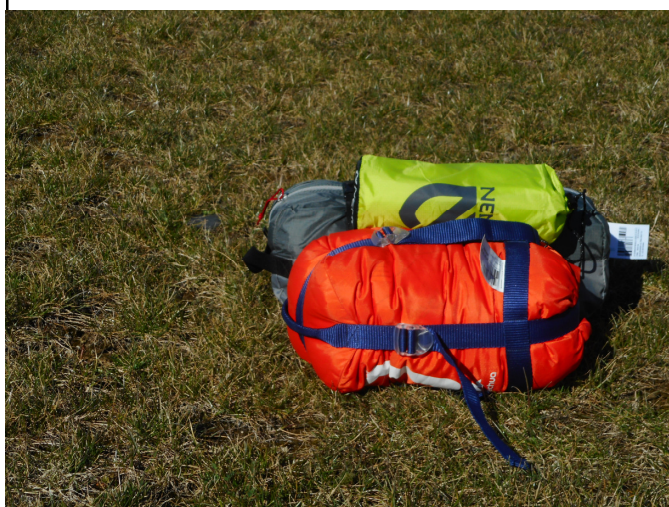
Les trois composants pour dormir: pour vous donner un ordre d'idée le sac de couchage mesure 32x16 cm., le sac gris contient la tente.

se. Par contre son prix est inversement proportionnel à sa masse,