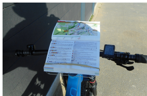
Vue sur le poste de « pilotage » avec ici la 1ère étape en partant de Vézelay. Pour moi les guides Miam miam sont mieux conçus que chez Lepere