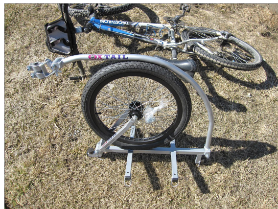
Ci-dessus conçu par un anglais exilé au Portugal, la remorque Oxtail accepte 20 kg, fourmille de détails pratiques. Ci dessous l'attelage complet lors u premier essai

2) la remorque. Choisie suite à un essai comparatif (expémag) vu sur internet, je l'ai baptisée C.O.P.21 pour Chariote Opérationnelle pour 2021 vu que je l'ai achetée lors de la C.O.P. 21, la conférence sur le climat de Paris (2016). De conception particulièrement bien pensée, elle se replie aisément, le plateau peut s'allonger et deux petits tampons de caoutchouc (élastomères) procurent une mini suspension. Mono roue, elle ne prend pas de place en largeur sur les chemins hormis la longueur de l'attelage mais ça, c'est une autre histoire.