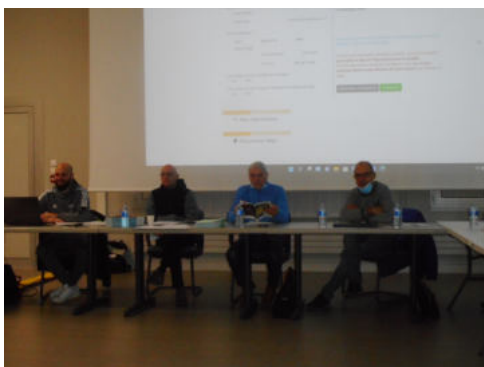
Photos: à gauche, des dirigeants qui présentent l'action « le Kid Bike », à droite, des clubs pleinement attentifs

Cette seconde journée a permis aux formateurs et aux bénévoles des écoles de vélo de s'approprier le carnet de progression du Kid Bike, qui intègre les différents niveaux attendus par le dispositif national « Savoir Rouler A Vélo ». Comme les premiers niveaux du Kid Bike, il a pour but de favoriser la mobilité active des enfants âgés de 6 à 12 ans, et leur permettre de tous savoir faire du vélo lorsqu'ils vont rentrer au collège. C'est donc tout naturellement que le premier plateau Kid Bike, organisé par l'AMSQ le mercredi 4 mai dernier, a réuni 70 jeunes des écoles de vélo des départements de la Meurthe-et-Moselle et de la Moselle, avec le concours des bénévoles formés. »