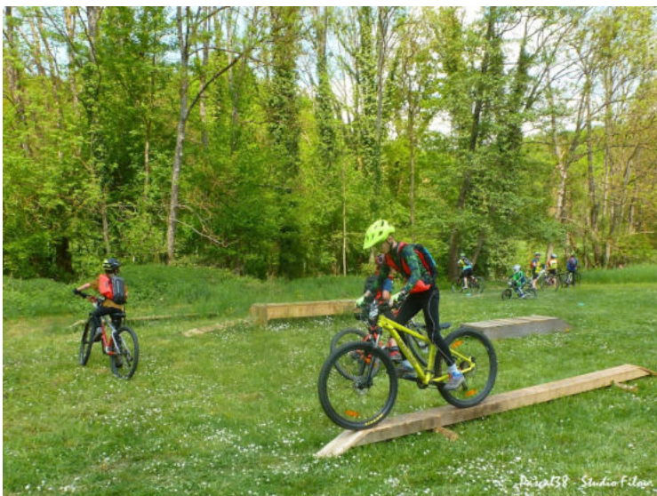
Ci contre l'exercice de la « poutre ». Ci-dessous celui d'un des 2 « coffres » avec à droite le serpent en lattes.